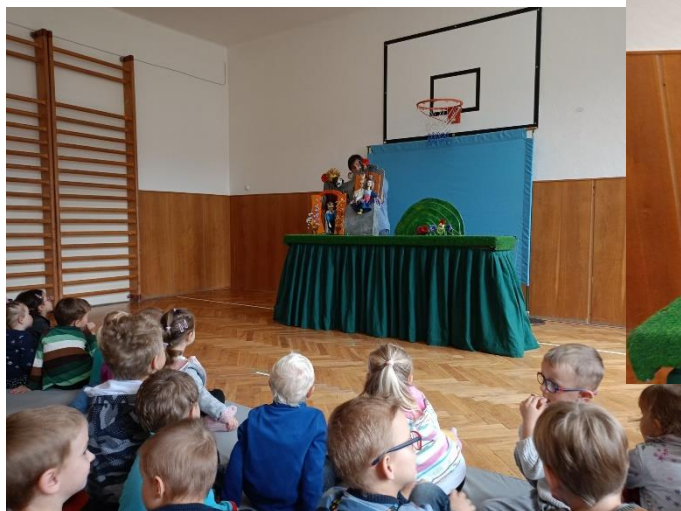
Loutkové divadlo Hrubec